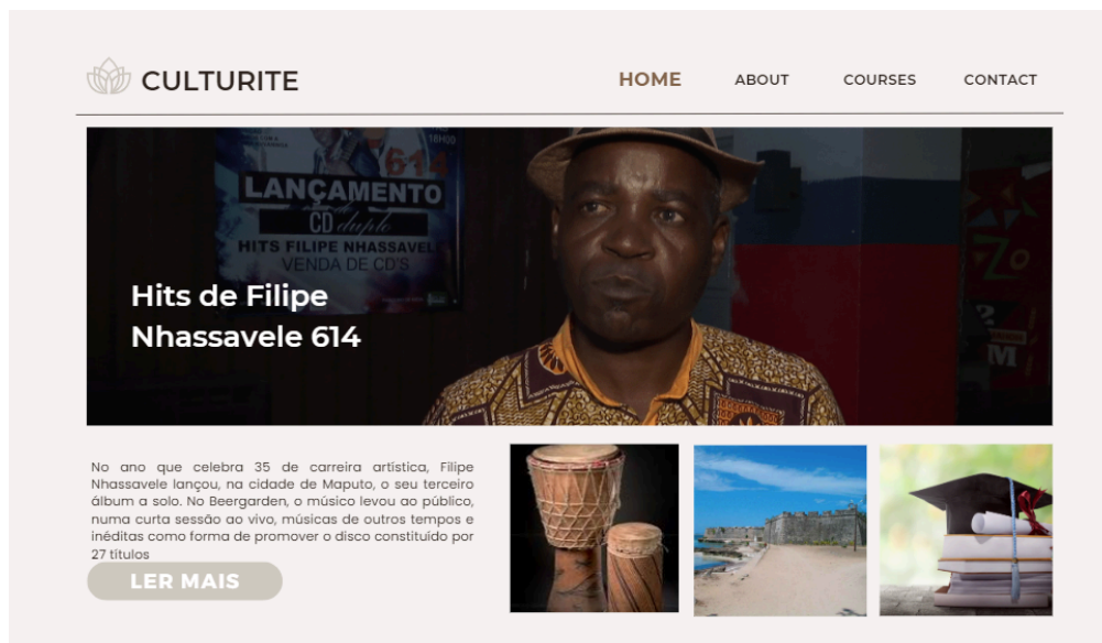
Imagem 1: Front page do Culturite 2

O layout do site será simples e interativo com textos curtos para quem não tem muito tempo mais com opção de textos mais longos e detalhados para quem visita o site com mais tempo.