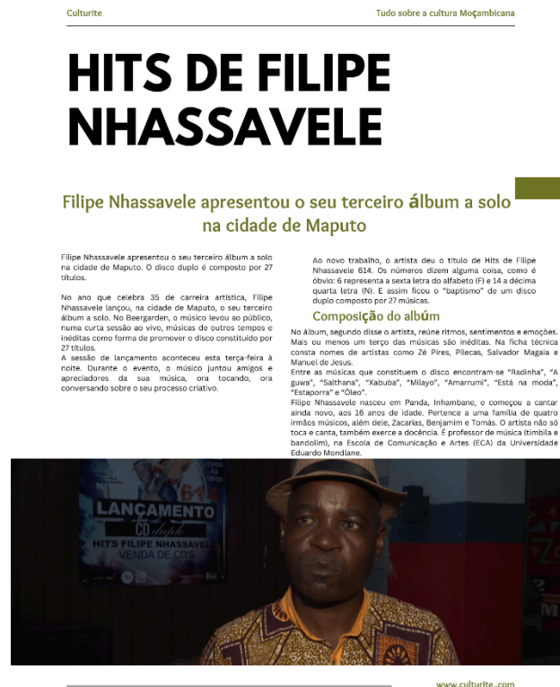
Imagem 2 3 : páginas do site culturarte 4

As páginas principais serão compostas por texto e imagens relacionados aos conteúdos da página inicial, sendo que o click nas imagens será direcionado aos textos com mais detalhes da publicação.